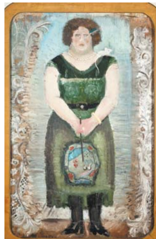
«Дама с мышкой»