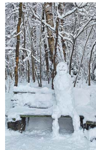
«Чудесный снеговик на скамейке в Ржевском лесопарке», – Лина.