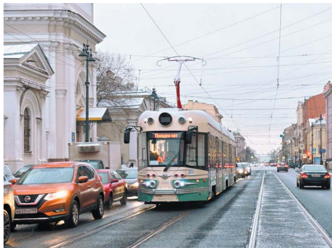
В прошлом году в рамках комплексной программы развития электротранспорта в Петербурге заменили более 25 километров одиночного трамвайного пути

Известно, что этот парк будет состоять из двух площадок. На них разместятся