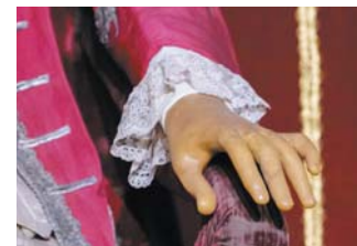
Лицо, кисти и стопы императора отлиты из воска, все остальные части тела выточены из дерева