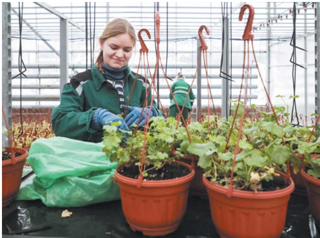
Петербургские садовники готовят цветы для весеннего и летнего сезонов

Неве украсят более 4,5 млн однолетних цветов и более 60 тыс. многолетних. К каждой локации специалисты подбирают свой «зелёный» ассортимент. Уже готовы эскизы оформления парков, садов и набережных. Свои планы анонсировали и разные районы Петербурга. В Красногвардейском районе первыми взойдут тюльпаны