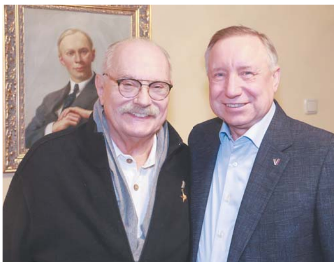
Александр Беглов встретился с Никитой Михалковым