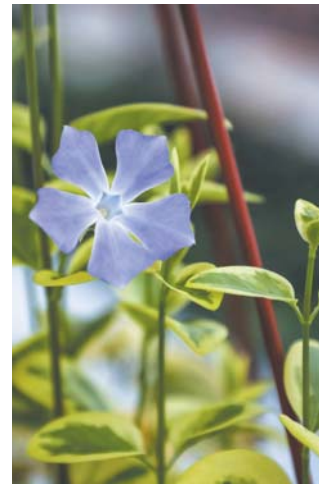
Многолетнее растение барвинок из оранжерей в Пушкине

– их высадили ещё осенью. В июне появятся пеларгонии, колеусы, вербены, петунии, декоративная капуста. Приморский район отличится тремя гигантскими цветниками. Все рекорды грядущего сезона побьёт композиция на Ушаковской набережной: на площади 500 кв. метров высадят 37 тыс. цветов. Разделительный газон на Бога-