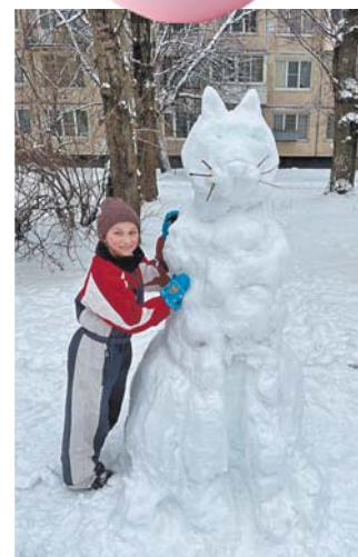
Петербургский снежокот от наших читателей.